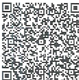
Invoice by square