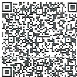
Pay by square